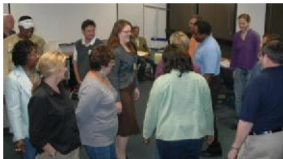
Taller de Intervención en Desastres y Crisis, 19-20 Oct. 2007

En nuestra biblioteca virtual de GFSC ( http://www.globalfacilitators.org/VirtLib.htm ), tenemos manuales para adultos, niños/as y facilitadores/as, que ayudan a individuos y grupos a aprender maneras efectivas para alcanzar un reajuste a largo plazo después de la crisis. Nosotros compartimos estas publicaciones como un servicio público.